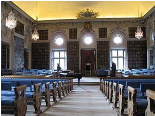
Riddarhussalen.

Trapporna leder oss vidare till den stora Riddarhussalen, vars väggar från golv till tak är tapetserade med de introducerade adelsätternas vapensköldar. Salen har dessutom en magnifik takmålning utförd av David Klöcker Ehrenstrahl. Konstverket heter Dygdernas rådslag och är gigantiskt stort.