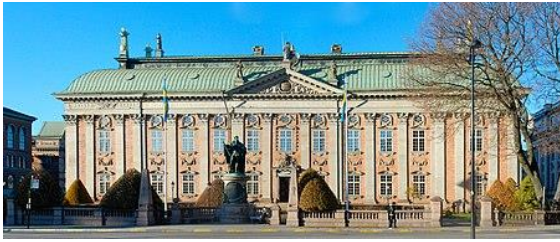
Riddarhuset.