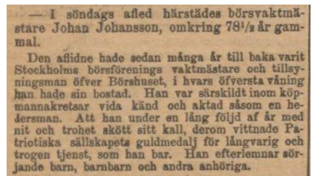
Dagens Nyheter 1897-07-07.

Den 7 juli dyker denna ganska kortfattade men talande notis upp i Dagens Nyheter .