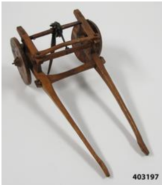
3) Stenkärra.