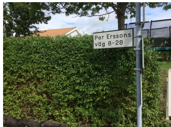
Per Erssons väg 2021-08-19.