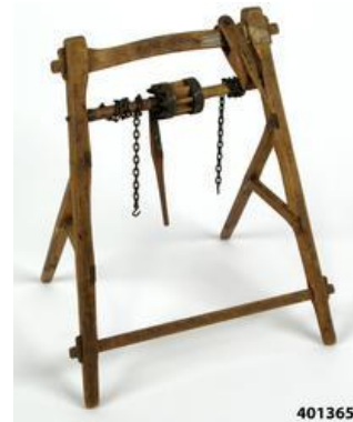
1) Stenkran.