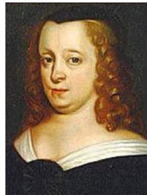
Ebba Brahe (1596–1674).

Ebba Brahes väg är en del av den gamla Stäketvägen som lär ha funnits i varje fall från tidig medeltid. Vägen går i de delar av Rotebro som numera heter Rotebro centrum och Gillberga. Gården Ebba (Magnusdotter) Brahe (1596–1674) ägde i närheten var Runsa i Upplands Väsby. För att komma dit landvägen kan hon ha färdats på Stäketvägen/Ebba Brahes väg, tagit av