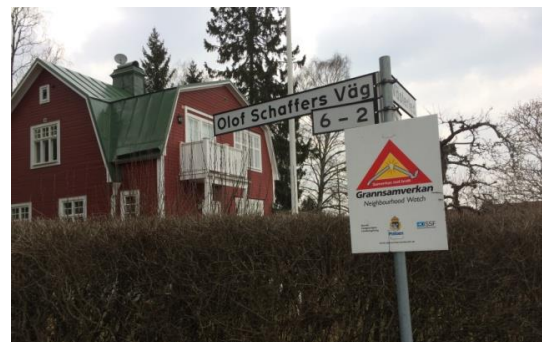
Olof Schaffers väg 2021-03-11.