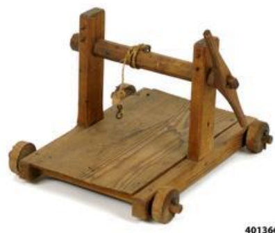
2) Vindspel.