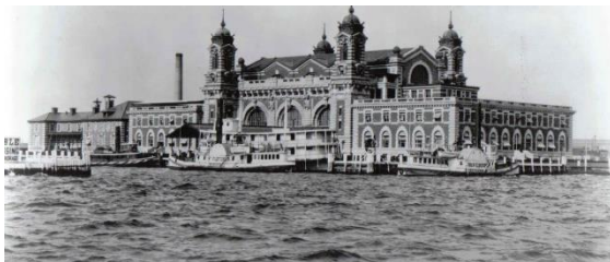
Ellis Island.

New York var den stora inresehamnen i USA. Från 1855 fungerade Castle Garden på Manhattans sydspets som immigrantstation och från 1892 Ellis Island (en ö i New Yorks hamninlopp). Kontrollen på Ellis Island tog allt mellan 2 till 5 timmar och immigranttjänstemännens huvuduppgift var att inte släppa in personer i USA som man misstänkte skulle komma att ligga samhället till last. Därför var det viktigt att man var arbetsför, hade tillräckligt med pengar för att klara sig den första tiden och inte bar på någon smittsam sjukdom, annars kunde man nekas inträde. Därför var det bra att kunna ange en släkting eller vän som man skulle bo hos den första tiden.