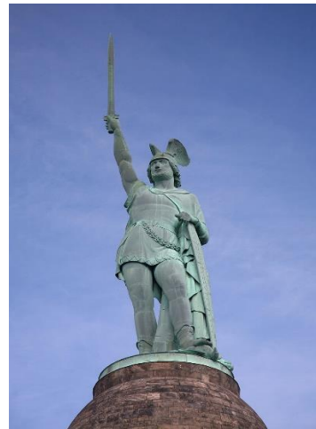
Hermannsdenkmal. Staty av Ernst von Bandel.