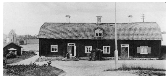
Rotebro gästgivaregård på 1920-talet