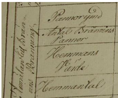
Utdrag ur mantalslängd för Östergötlands län 1817

Flera överflödsförordningar utfärdades. År 1766 förbjöds till exempel kaffe samt vissa importerade sprithaltiga drycker. Användandet av tobak och snus skulle anmälas vid mantalsskrivningen och fördes redan vid mitten av 1750-talet ibland, inte alltid, in i mantalslängderna. Kvinnor befriades dock från tobaksskatt 1771, å andra sidan fick de från 1789 betala avgift för sidenkläder.