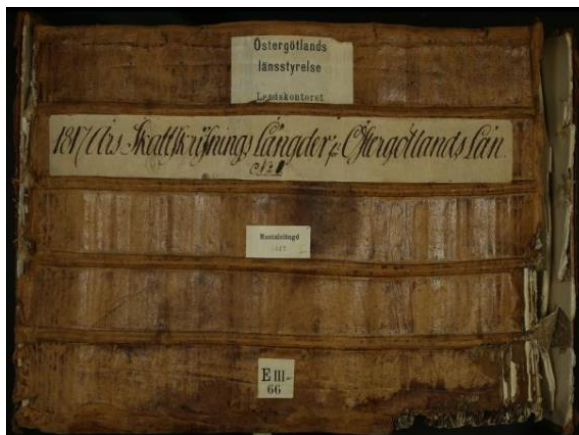
Mantalslängder för Östergötlands län 1817.

Kyrkböcker är ett centralt material för alla släktforskare men viktiga kompletterande uppgifter kan finnas i bland annat mantalslängderna. För den som bedriver forskning kring gårdar och socknar är mantalslängderna en helt outhärlig källa. De sträcker sig också vanligen längre bak i tiden än kyrkböckerna.