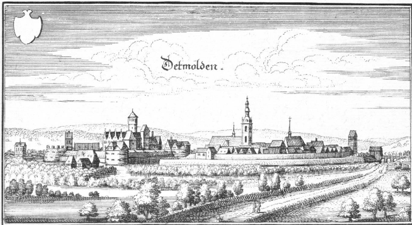
Kopparstick av Matthäus Merian 1647.

Medlemsblad för Sollentuna Släktforskare nr 1 - 2022